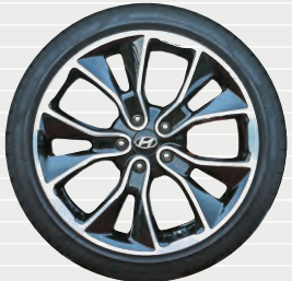
Leichtmetallfelgen 19" 235/35 R19